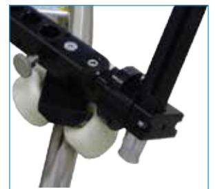
Push Bar Connection