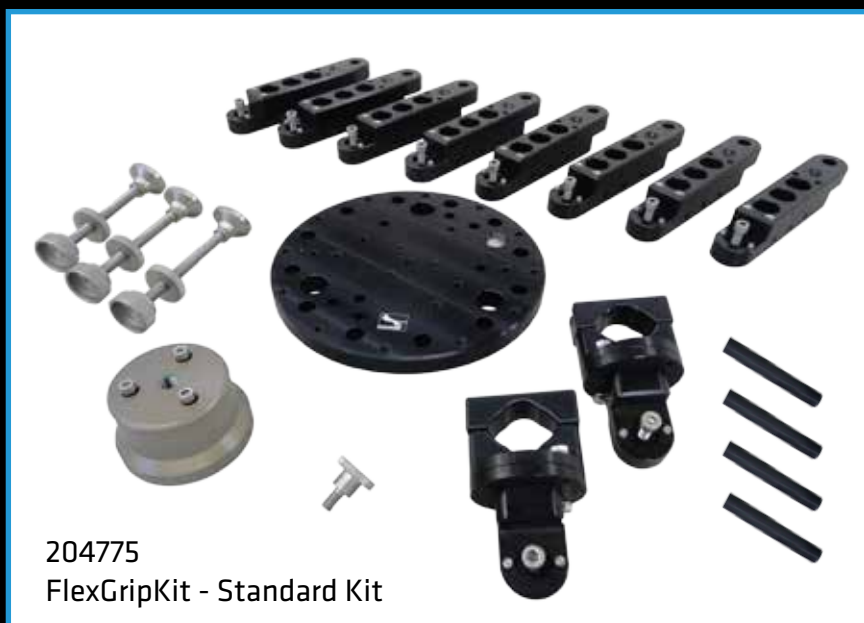
204775 FlexGripKit - Standard Kit

The FlexGripKit Standard version consists of: